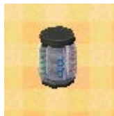
Ten Billion Barrel